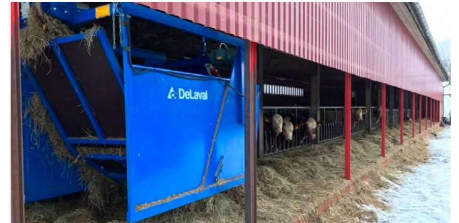
Den elektriska fodervagnen löper utmed hela foderbordet och ger en effektiv och smidig utfodring till djuren.

Med stöd från Klimatklivet underlättar numera den eldrivna fodervagnen det dagliga arbetet på gården Enkullen i Ölme utanför Kristinehamn. Investeringen gynnar både miljö, människor och ekonomi. Nya mål om investeringar finns för att ytterligare minska gårdens klimatpåverkan.