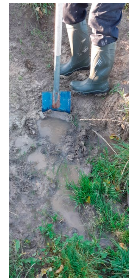
Bild 4: Vatten som tyder på att kulverten läcker. Spola kulvertar så att det blir ett bra flöde.