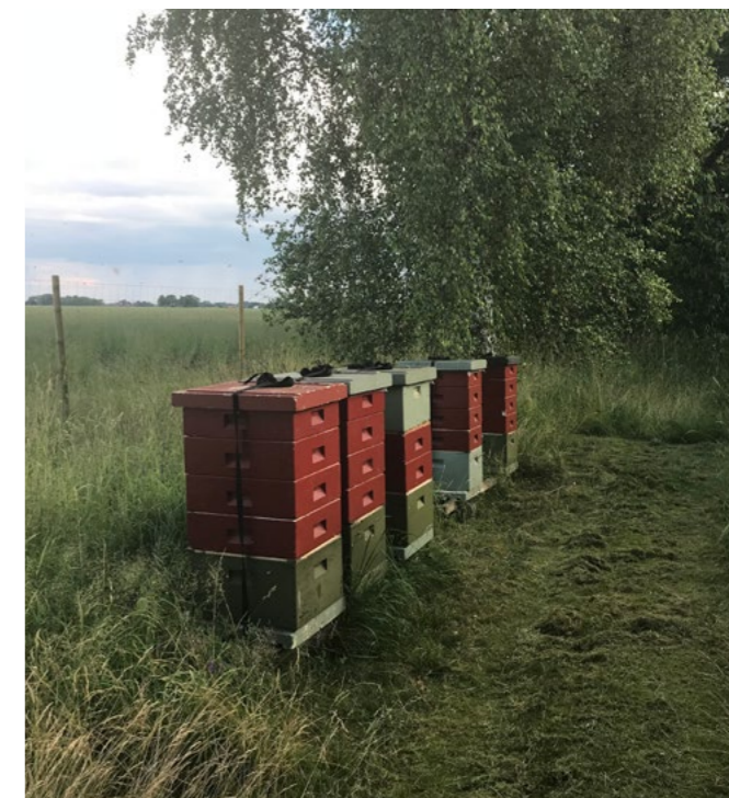
Gårdens honungsbin är mycket viktiga för att utsädesodlingen av vitklöverfrö ska lyckas.