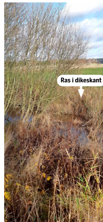
Bild 2: Håll undan sly och buskar för att inte underminera diken.