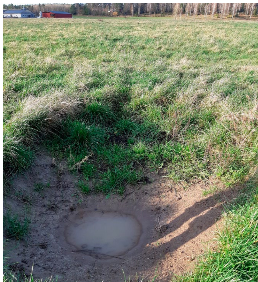
Bild 1: Här har ett täckdiksesöga rasat. Genom att laga det så kan vattnet rinna fritt igen.