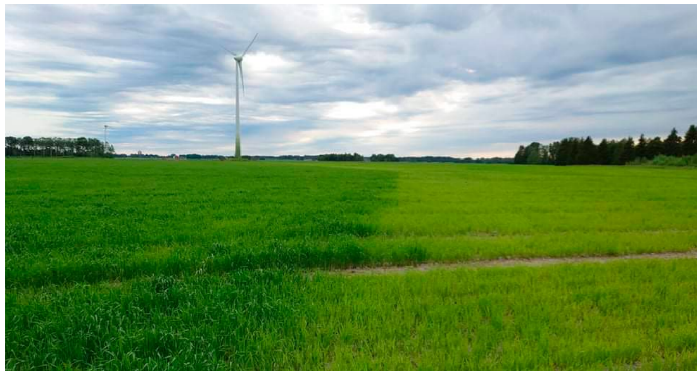
Att odla vitklöver som förfrukt är ett bra sätt att tillföra kväve till marken, något som syns tydligt till vänster på denna bild från gården.