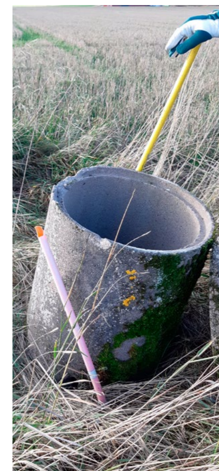
Bild 3: Se över alla brunnar så att de inte är fyllda med slam. Laga de som är trasiga.